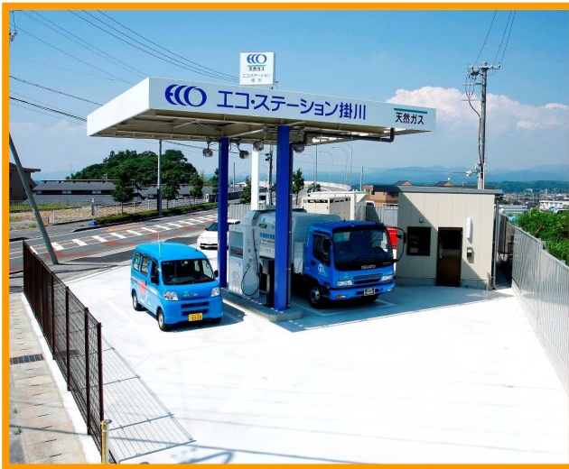
エコ・ステーション掛川(掛川市長谷)